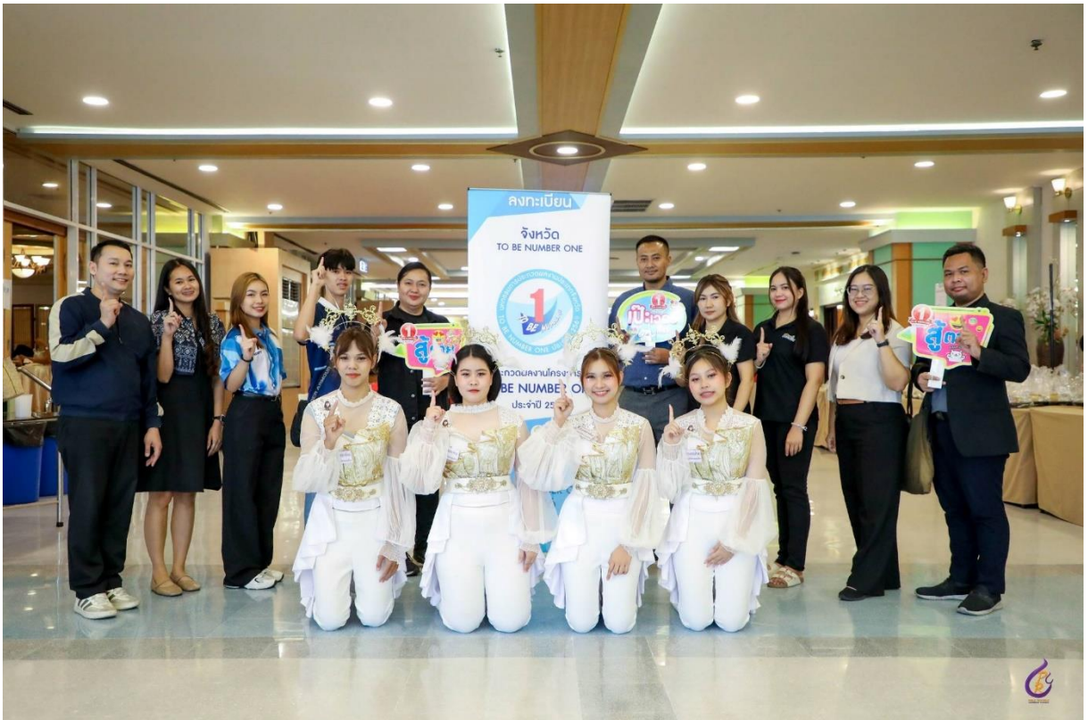
กิจกรรมในงานมหกรรมรวมพลสมาชิก TO BE NUMBER ONE ประจำปี ๒๕๖๔ (ที่มจักรพงษ์ภูวนารถ) ระดับภาคกลางและภาคตะวันออกเฉียงเหนือ วันที่ ๔ - ๕ มีนาคม ๒๕๖๔ ณ โรงแรมเอเชีย แอร์พอร์ท จ.ปทุมธานี