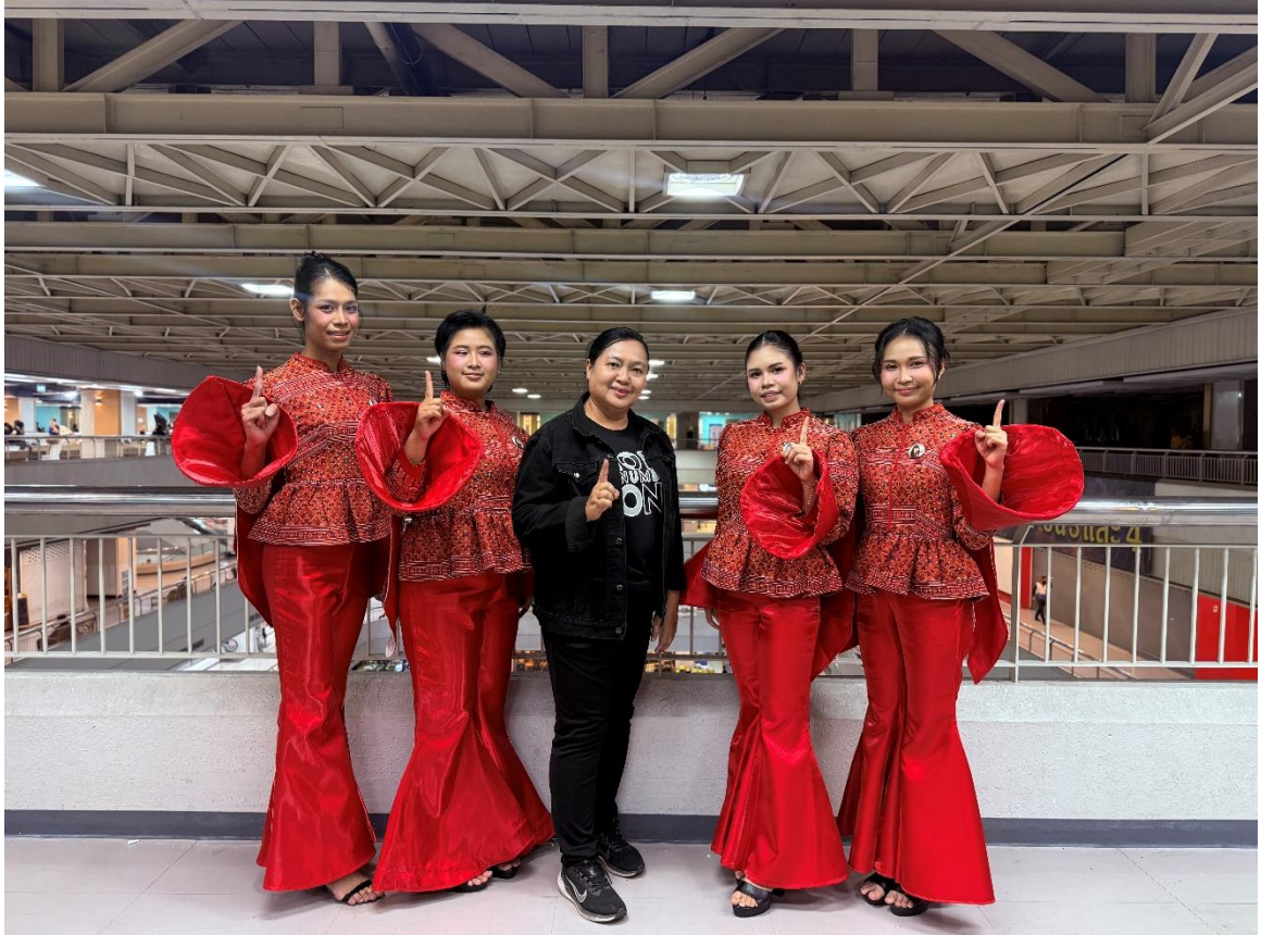
กิจกรรมในงานมหกรรมรวมพลสมาชิก TO BE NUMBER ONE ประจำปี ๒๕๖๙ ระดับภาคกลางและภาคตะวันออก วันที่ ๔ - ๕ มีนาคม ๒๕๖๙ ณ โรงแรมเอเชีย แอร์พอร์ท จ.ปทุมธานี