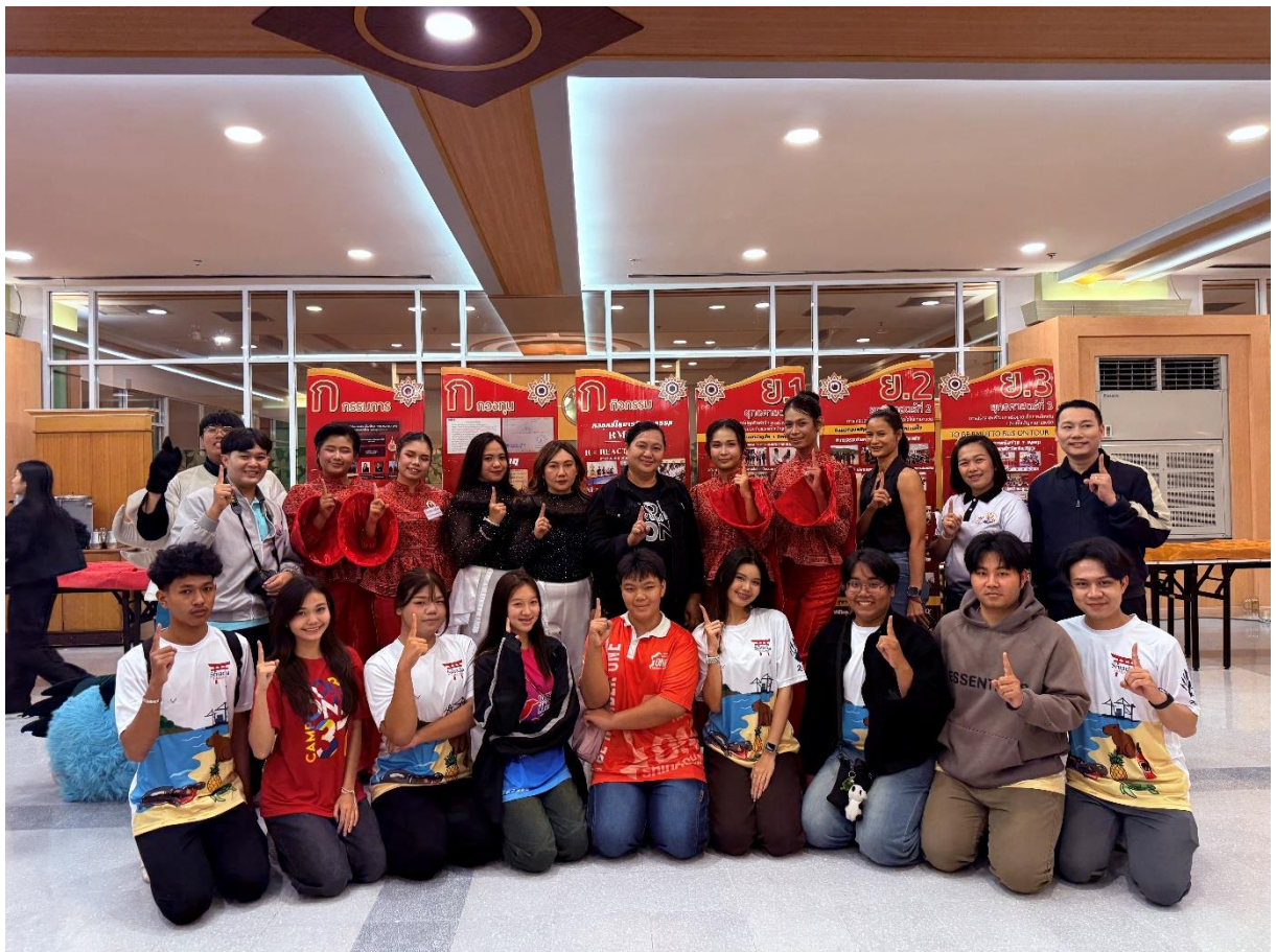
กิจกรรมในงานมหกรรมรวมพลสมาชิก TO BE NUMBER ONE ประจำปี ๒๕๖๔ (ที่มบางพระ) ระดับภาคกลางและภาคตะวันออก วันที่ ๔ - ๕ มีนาคม ๒๕๖๔ ณ โรงแรมเอเชีย แอร์พอร์ท จ.ปทุมธานี