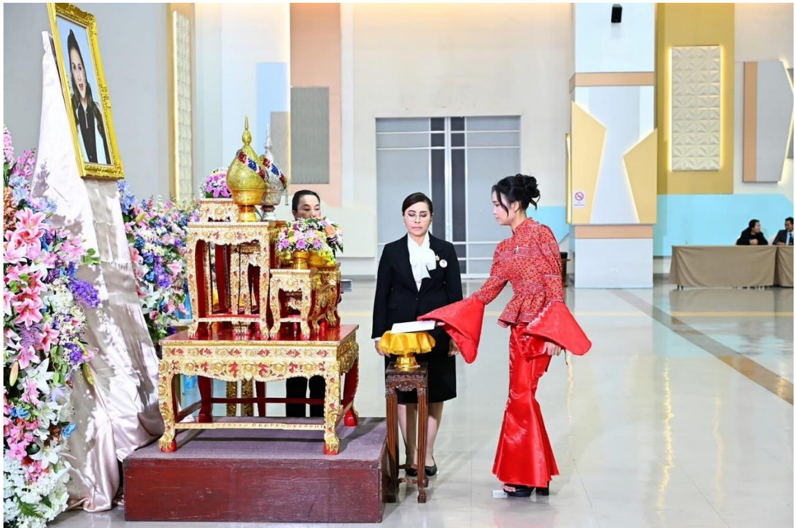
ภาพรับพระราชทาน เกียรติบัตร “รักษามาตรฐานต้นแบบระดับทอง” ปีที่ ๓ ผ่านการคัดเลือกเข้าสู่ การประกวดกลุ่มต้นแบบ ระดับประเทศ จากทูลกระหม่อมหญิงอุบลรัตนราชกัญญา สิริวัฒนาพรรณวดี วันที่ ๔ - ๕ มีนาคม ๒๕๖๙ ณ โรงแรมเอเชีย แอร์พอร์ท จ.ปทุมธานี