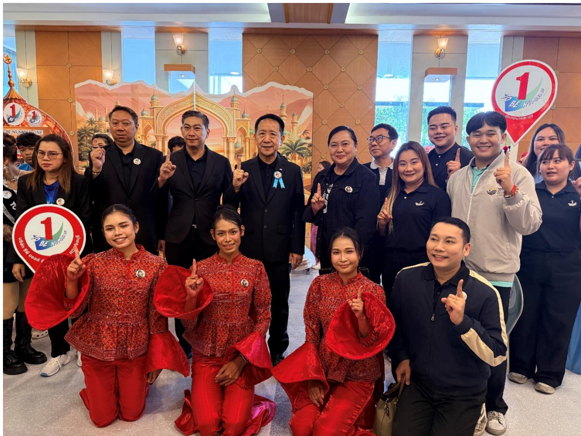
นายนิรศ นิรามัยวงศ์ ผู้ว่าราชการจังหวัดชลบุรี เยี่ยมชมและให้กำลังใจ ชมรม TO BE NUMBER ONE มทร.ตะวันออก และเครือข่ายภายในจังหวัดชลบุรี ในการประกวด ระดับภาคกลางและภาคตะวันออก วันที่ ๔ - ๕ มีนาคม ๒๕๖๙ ณ โรงแรมเอเชีย แอร์พอร์ท จ.ปทุมธานี