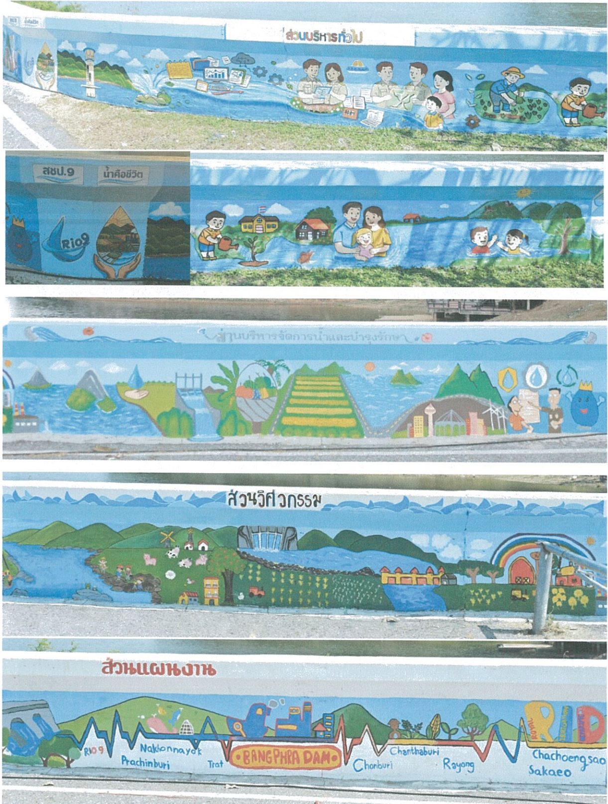
ตัวอย่างผลงานวาดภาพระบายสีบนกำแพงคอนกรีตบริเวณสันเขื่อนอ่างเก็บน้ำบางพระ