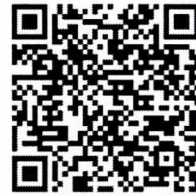
QR Code รายละเอียดกิจกรรม

๘.๒ ส่งผลงานเข้าร่วมการประกวด ทางไปรษณีย์อิเล็กทรอนิกส์ที่ culture.scm02@gmail.com ภายในวันที่ ๒๘ มิถุนายน ๒๕๖๗ เวลา ๑๖.๓๐ น. ประกอบด้วย