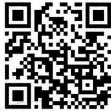
QR Code รับสมัคร

๘.๑ สามารถสมัครผ่านระบบออนไลน์ https://forms.gle/fPhwTQaHMdduywv9 หรือตาม QR Code ด้านล่าง ภายในวันที่ ๒๘ มิถุนายน ๒๕๖๗ เวลา ๑๖.๓๐ น.