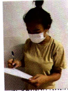
ภาพที่ 1 แสดงขั้นตอนการผลิตสื่อประชาสัมพันธ์

ตอนที่ 2 ผลการศึกษาลักษณะทางประชากรศาสตร์ของเจ้าของสัตว์เลี้ยงที่มาใช้บริการ พบว่า กลุ่มตัวอย่างเป็นเพศหญิง (ร้อยละ 60) มีอายุ 21-30 ปี (ร้อยละ 42) มีการศึกษาต่ำกว่าปริญญาตรี (ร้อยละ 61) มีอาชีพพนักงานเรียน/นักศึกษา (ร้อยละ 38) และมีรายได้ต่อเดือน 10,001 - 15,000 บาท (ร้อยละ 31) ดังแสดงในตารางที่ 1