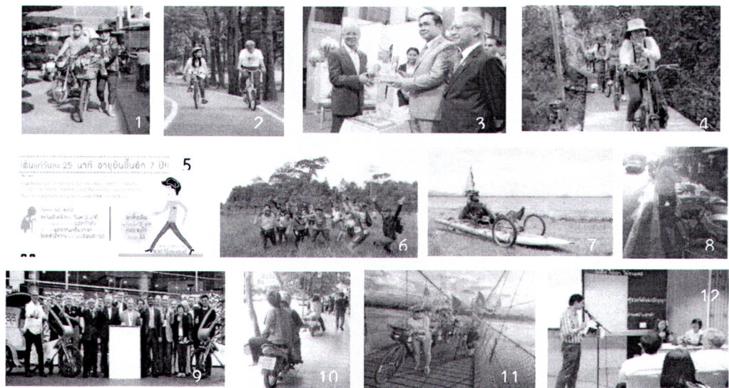
ภาพที่ 1 ตัวอย่างการใช้ภาพประกอบเพื่อใช้ในการประกอบสร้างความหมายทั้ง 12 ประเด็น

“ช่วงกรกฎาคม 2559 ที่ผ่านมา โครงการขับเคลื่อนนโยบายสาธารณะการเดินและการใช้จักรยานในชีวิตประจำวัน ได้ประกาศรับทุนงานวิจัยเดิน จักรยาน ประจำปี 59-60 แนวคิดหลักของทุนที่ประกาศคือ เมือง ชุมชนที่เป็นมิตรต่อการเดินและการใช้จักรยาน (Walk and Bike Friendly City) ทุนรวมประมาณ 500,000 บาท 15 โครงการ” (สร้อยดี โจรนกุล, 2559)