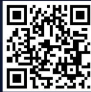
คิวอาร์โค้ดแบบฟอร์ม

1. ให้นักศึกษาสแกน คิวอาร์โค้ดข้างล่างเพื่อกรอกแบบสอบถาม ระหว่างวันที่ 30 มิถุนายน 2566 - 3 กรกฎาคม 2566