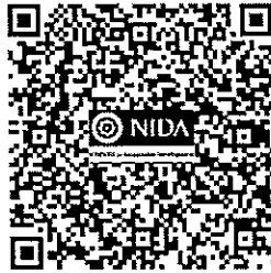
QR Code for International Papers Submission