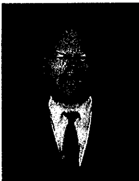
๓. พันตำรวจเอก มนต์ นครศรี อดีตรองผู้บังคับการ กองอำนาจการตำรวจภูธรภาค ๑