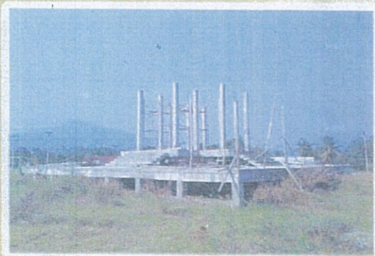
รูปภาพจริงอยู่ระหว่างก่อสร้าง