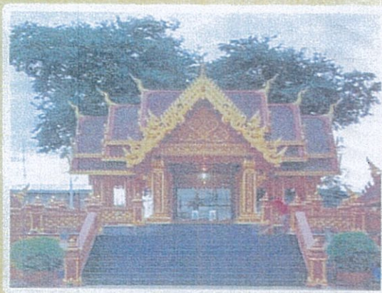
รูปภาพจำลอง

วันที่ 1 มกราคม พ.ศ. 2566 เวลา ๐๗.๓๘ น. ทำบุญตักบาตร ๐๘.๐๐ น. ถวายภัตตาหาร ๑๐.๐๐ น. ถวายผ้าป่า เป็นอันเสร็จพิธี