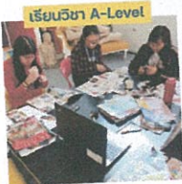
เรียนวิชา A-Level