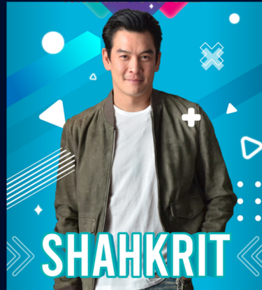
ดารารายยอดเยี่ยม