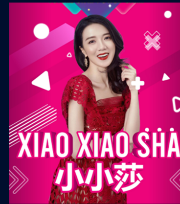
KOL ด้านแฟชั่น และการท่องเที่ยว