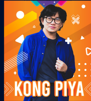
ผู้จัดละครประเทศไทย