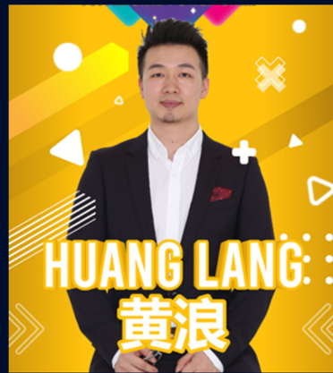
สื่อมวลชนระดับอาวุโสของประเทศจีน