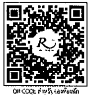
QR CODE สำหรับจองห้องพัก โทร: ๐๒-๔๒๒-๙๒๒๒

การสำรองห้องพัก ท่านสามารถจองห้องพักกับทางโรงแรมโดยสแกน QR-Code สำหรับจองห้องพัก หากท่านจองห้องพักภายหลังห้องพักอาจเต็มได้ และอาจจะไม่ได้ห้องพักราคาพิเศษ โรงแรมรอยัลริเวอร์ ๒๑๙ ซอยจรัญสนิทวงศ์ ๖๖/๑ แขวงบางพลัด เขตบางพลัด กรุงเทพฯ ๑๐๗๐๐ โทรศัพท์: ๐๒-๔๒๒-๙๒๒๒ โทรสาร : ๐๒-๔๓๓-๕๘๘๐ E-mail : rsvn@royalriverhotel.com