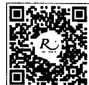
QR-Code สำหรับจองห้องพัก มหาวิทยาลัยศิลปากร

การสำรองห้องพัก ท่านสามารถจองห้องพักกับทางโรงแรมโดยสแกน QR-Code สำหรับจองห้องพัก หากท่านจองห้องพักภายหลังห้องพักอาจเต็มได้ และอาจจะได้ห้องพักราคาพิเศษ โรงแรมรอยัลริเวอร์ ๒๑๙ ซอยจรัญสนิทวงศ์ ๖๖/๑ แขวงบางพลัด เขตบางพลัด กรุงเทพฯ ๑๐๗๐๐ โทรศัพท์: ๐๒-๔๒๒-๙๒๒๒ โทรสาร : ๐๒-๔๓๓-๕๘๘๐ E-mail : rsvn@royalriverhotel.com