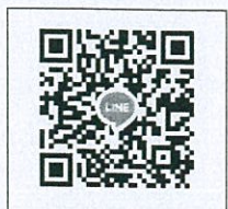
QR-Code เว็บไซต์ QR-Code เพื่อสอบถามข้อมูล