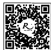
QR CODE สำหรับจองห้องพัก มหาวิทยาลัยศิลปากร

โทรศัพท์: ๐๒-๕๒๒-๙๒๒๒ โทรสาร : ๐๒-๕๓๓-๕๘๘๐ E-mail : rsvn@royalriverhotel.com