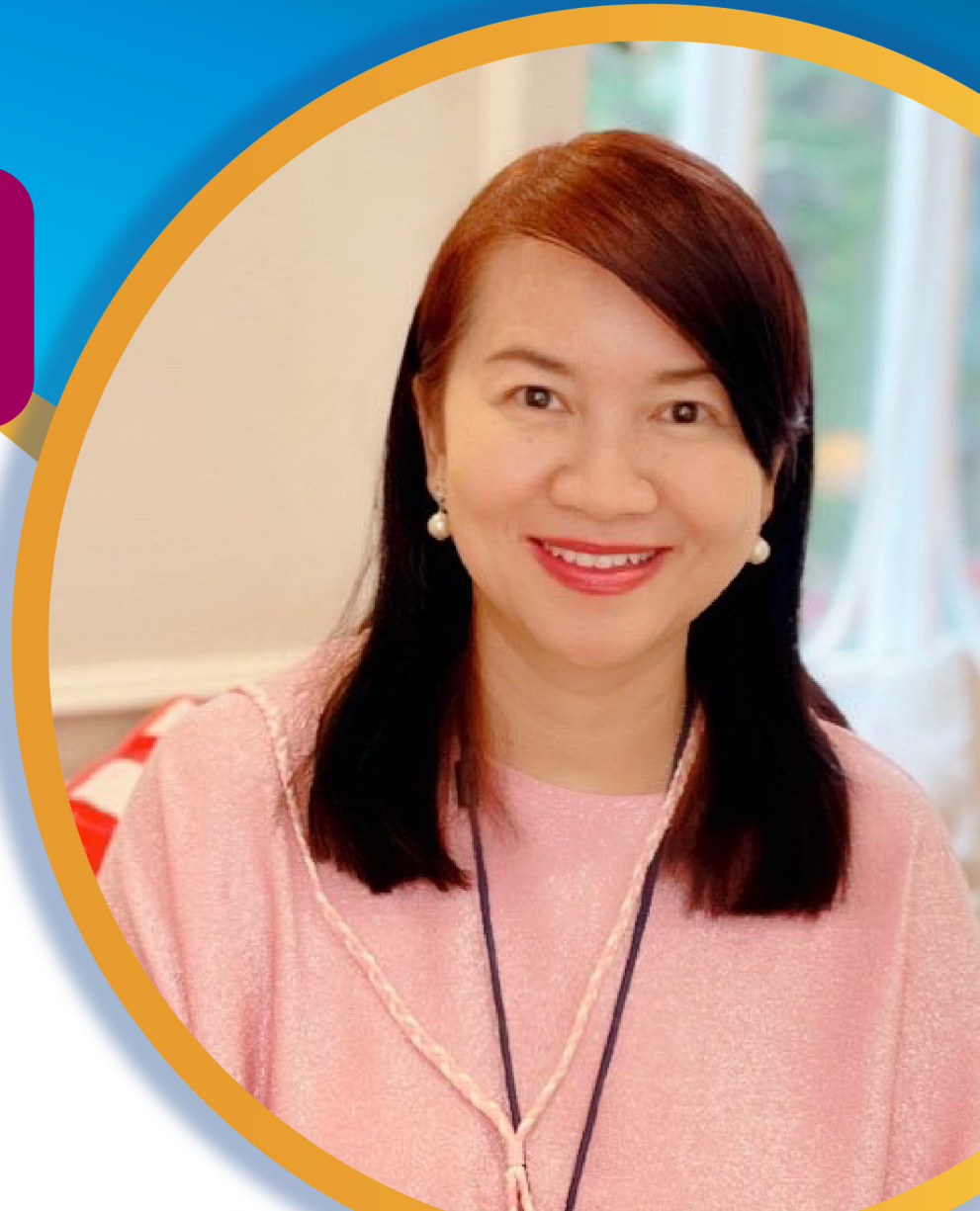
วิทยากร โดย รศ.ดร.เกสัชกรหญิง ภัณฑดา อนุวงศ์

การชำระเงิน : ธนาคารกรุงเทพ ชื่อบัญชี สำนักงานเลขานุการที่ประชุมอธิการบดี เลขที่ 169-006721-8 พร้อมนำหลักฐานการชำระเงินเข้าสู่ระบบ ในเว็บไซต์ลงทะเบียน First come, First serve ตามการโอนเงิน